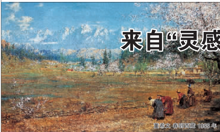
董希文 春到西藏 1955年